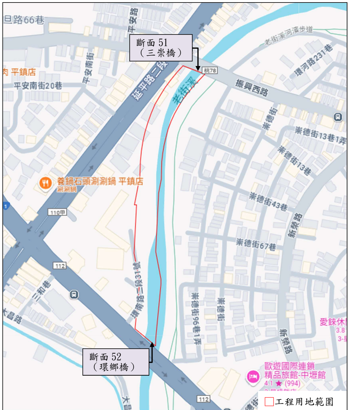
本案工程用地範圍示意圖