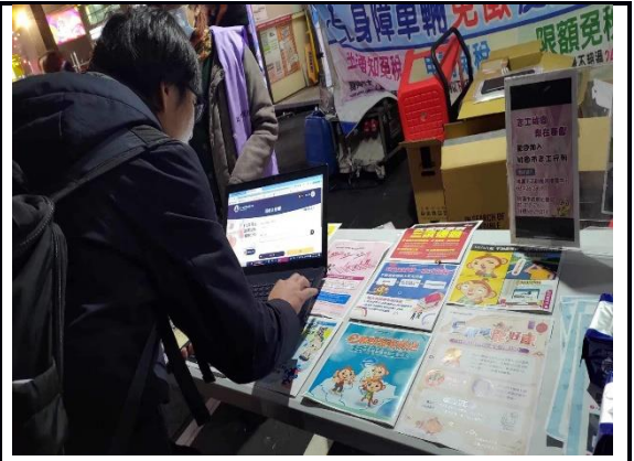
說明：宣傳本局稅務訊息。