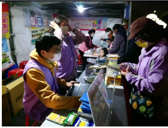
說明：捐雲端發票換好禮活動，培養民眾購物索取統一發票的習慣。