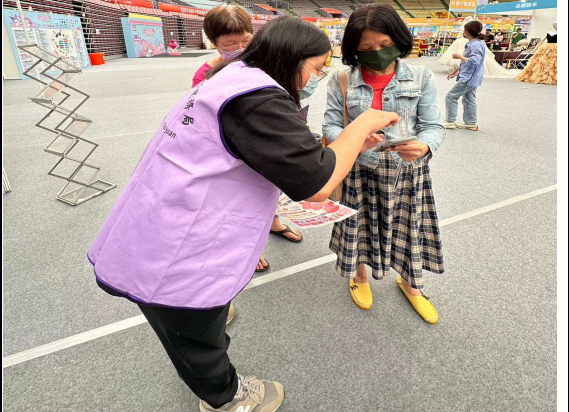
說明：現場舉辦「LINE@限定快閃抽獎活動」，藉此提高民眾的參與度及增添活動的互動性。