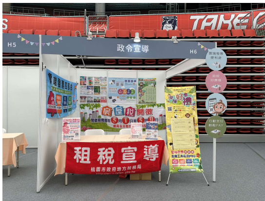
說明：懸掛房屋稅開徵及雲端發票四部曲布條。