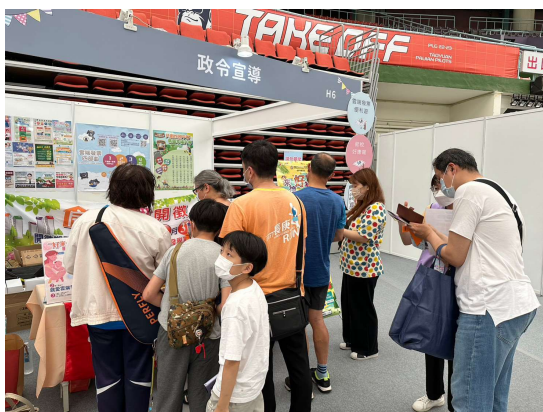
說明：現場宣導民眾下載統一發票兌獎 App，善用載具儲存雲端發票，並宣導追蹤本局 Facebook、YouTube 及 Podcast，獲得最新稅務資訊。