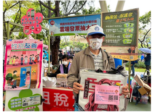
說明：加強宣傳本局「地方稅相關法規及各項便民服務」、「查詢金融遺產服務暨遺產稅申報稅額試算」等最新稅務訊息與便民服務。