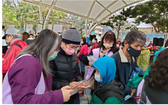
說明：協助下載財政部統一發票兌獎 App、載具歸戶、領獎設定及設定手機小工具。