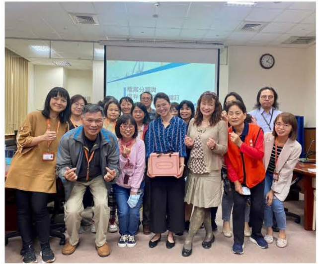
3月26日檔案管理教育訓練