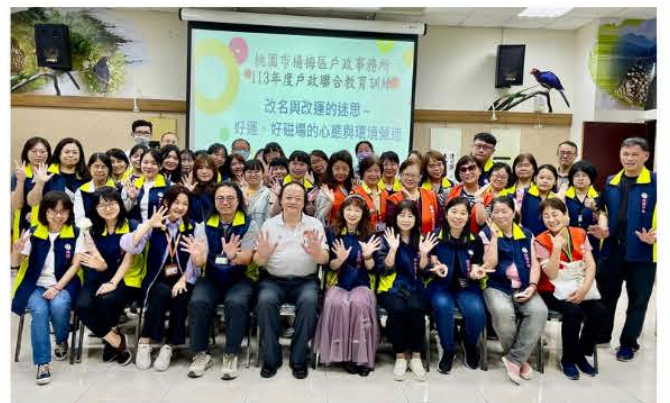
4月20日改運與改名的迷思 聯合教育訓練