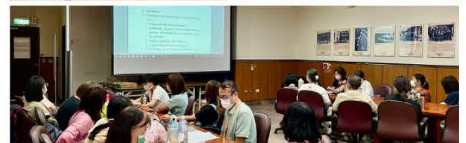
5月所務會議暨4~7月同仁慶生