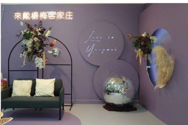
本所打造全新的結婚專區