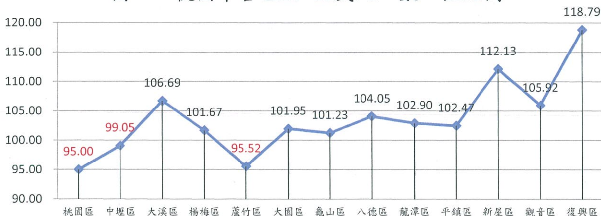
圖一、桃園市各區 20-49 歲人口數—性比例

單就性比例來看桃園市各區，以復興區的女性落單的機率最低(118.79)，其次為新屋區(112.13)及大溪區(106.69)；男性則以桃園區落單的機率最低(95.00)，其次為蘆竹區(95.52)及中壢區(99.05)。