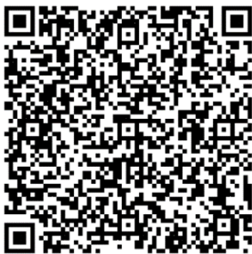
桃園市政府都市發展局 網站 QRcode

各公民或團體對計畫案如有任何意見，請利用說明會場所提供之意見表，於公開展覽期間以書面載明姓名或名稱、地址及建議事項，向本府都市發展局或桃園區公所提出(陳情意見表於本府都市發展局都市計畫科索取，或至本府都市發展局網站下載)。如有疑義，歡迎電洽本府都市發展局都市計畫科(03-3322101#5223 羅小姐)。