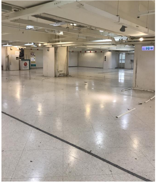
圖二、卸貨區改善後照片