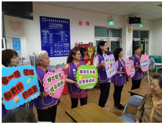
社區志工們持公所自製性平標語，向社區居民宣導 CEDAW 及性別平等