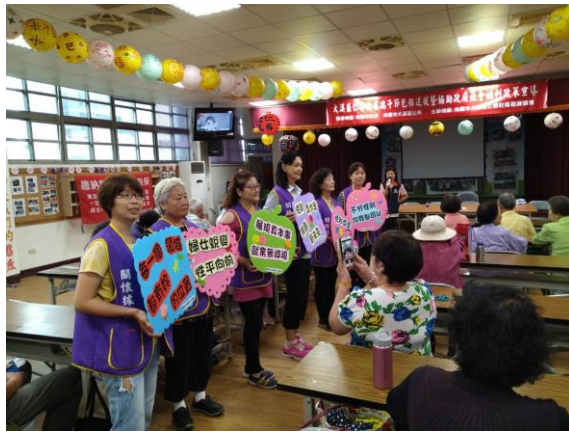
社區志工們持公所自製性平標語，向社區居民宣導 CEDAW 及性別平等