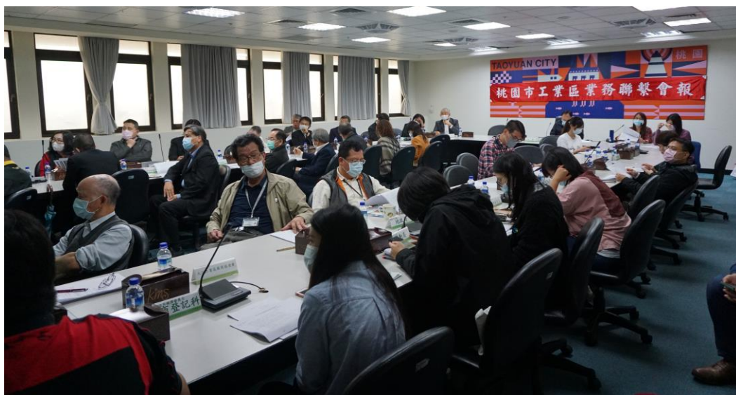
圖 3 工業區聯繫會報