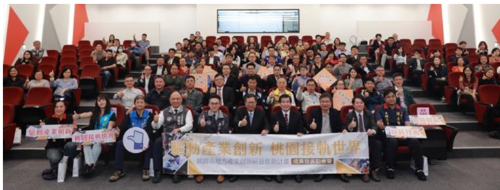
圖 1 109 年 SBIR 成果發表會