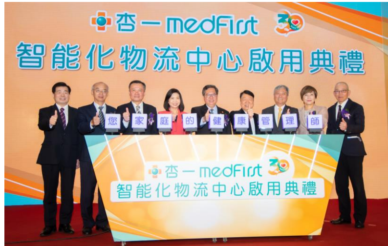
圖 5 杏一醫療公司楊梅區智能化物流中心啟用典禮