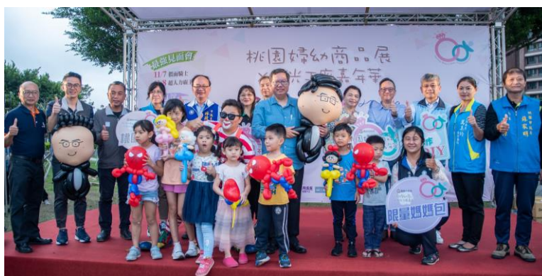
圖 6 桃園婦幼商品展 X 觀光工廠嘉年華開幕記者會