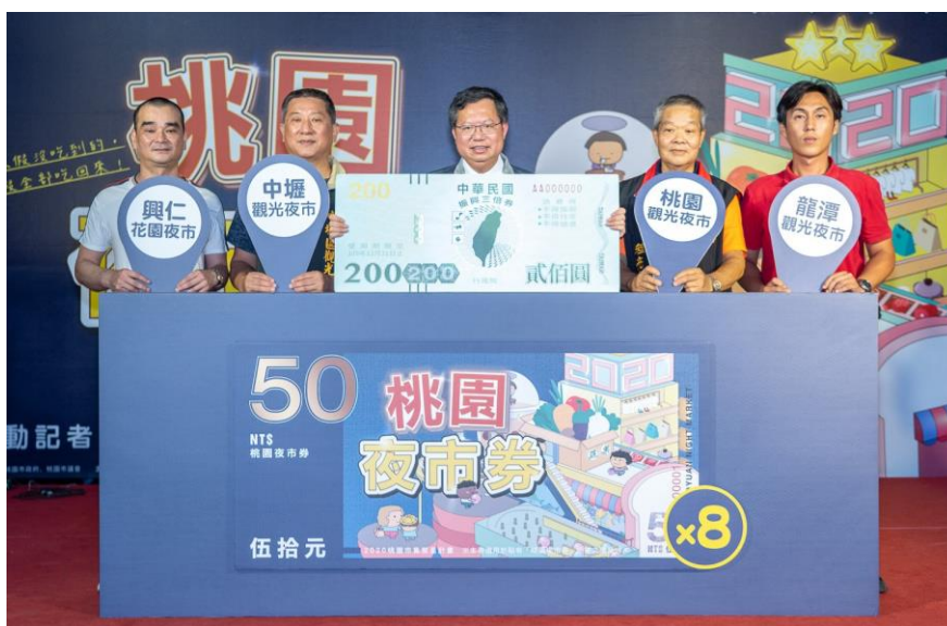
圖 8 桃園夜市券啟動記者會