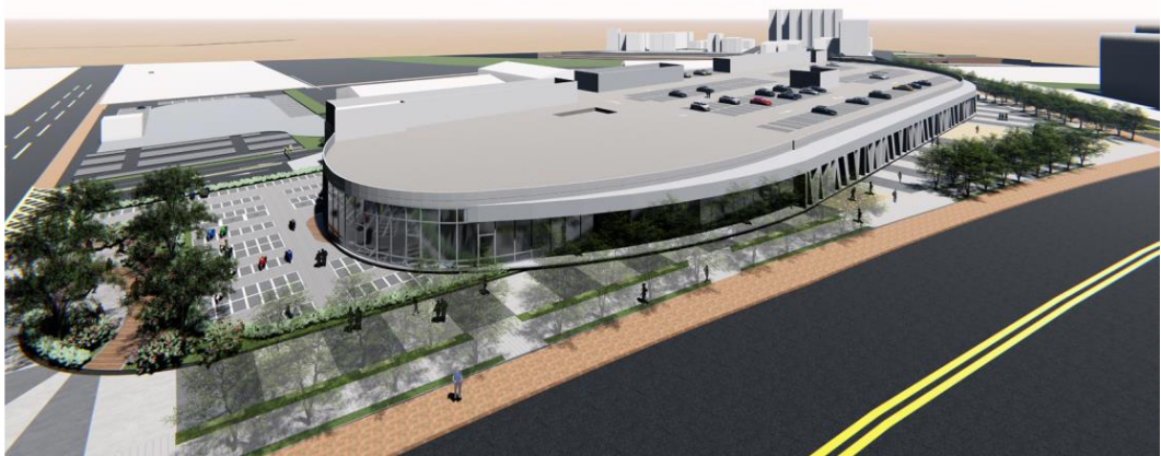
圖 9 新永和市場建築示意圖