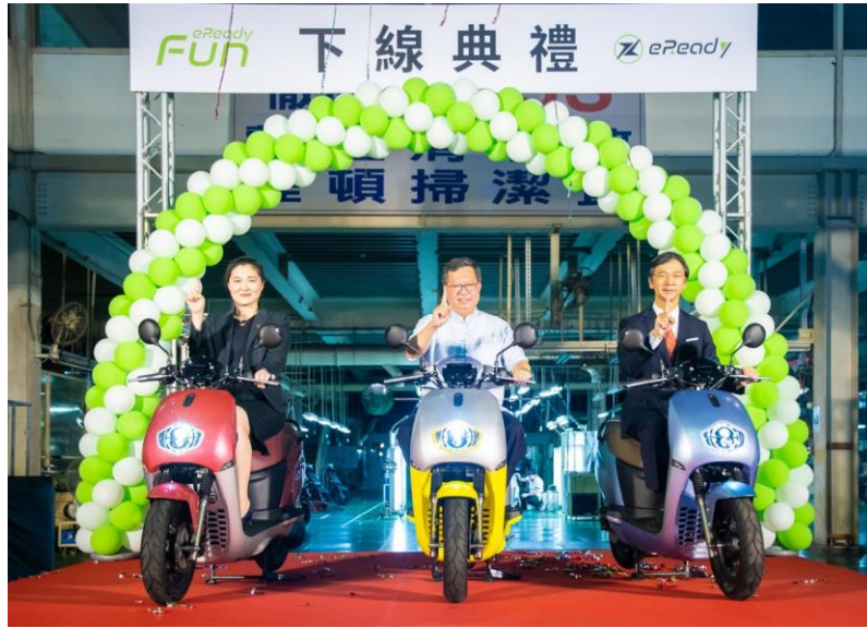
圖 4 台鈴工業中壢區新設旗艦店開幕暨新款電動車下線典禮