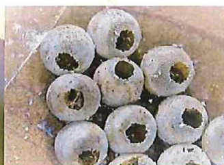
平腹小蜂羽化的卵孔-圓單孔狀

藥劑防治建議於清晨或傍晚進行，成蟲活動力較低。可依當年的氣候溫度(約1至2月下旬)，越冬的成蟲開始活動聚集於嫩梢時，進行第一次的施藥防治，於3月中旬後因成蟲活動力強，藥劑防治效果不佳，且已進入開花期，此時不建議用藥，以避免誤傷蜜蜂等授粉昆蟲，待至花期結束開始結小果後之荔枝細蛾防治階段，同時防治於葉背的荔枝椿象若蟲；用藥時請上網查詢防檢局公告核准藥劑。