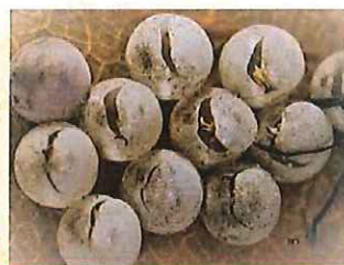
正常孵化的卵孔-長裂縫狀