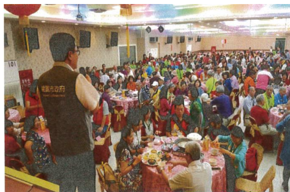
里鄰長踴躍參加本次活動。