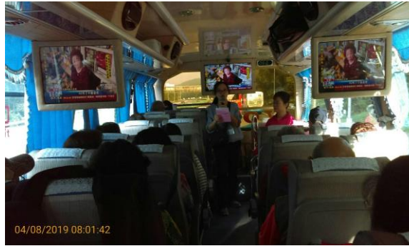
由專人搭配自製活動手冊向里鄰長講解性別平等。