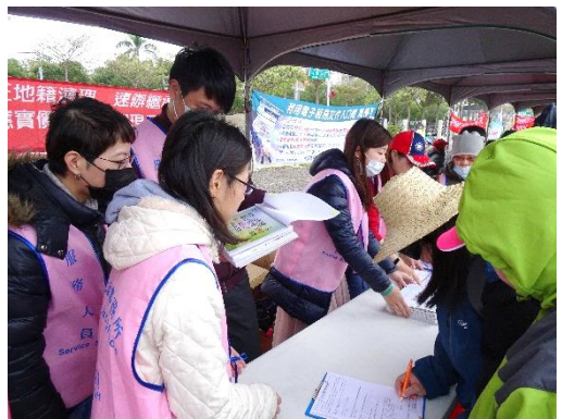
簡介：民眾填寫問卷情形