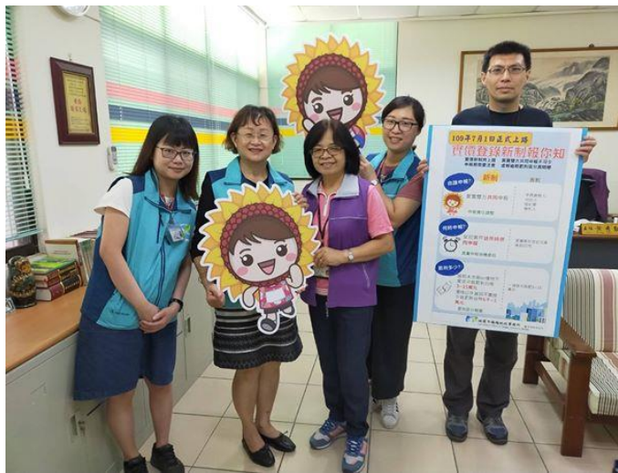
簡介：楊梅地政事務所主動出擊宣導實價登錄新制