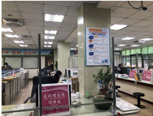
簡介：實價登錄新制宣導海報張貼處