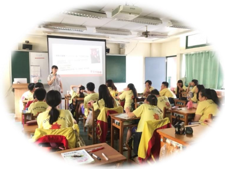
校園宣導，增進兒少防暴意識