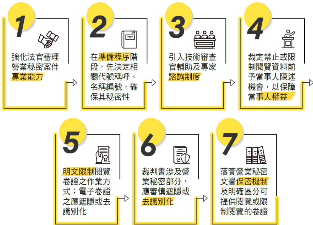
圖 1 《地方法院辦理營業秘密案件應行注意事項》重點摘要

此外，司法院同步修訂《法院辦理「秘密保持命令」及「偵查保密令」案件作業要點》，修改卷證提出、閱覽及調查方式等相關規定，以防止營業秘密因提出於法院導致外洩之風險。