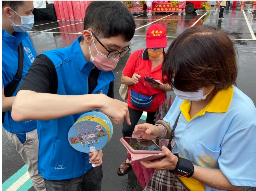
簡介：地政、檔案、性平有獎徵答