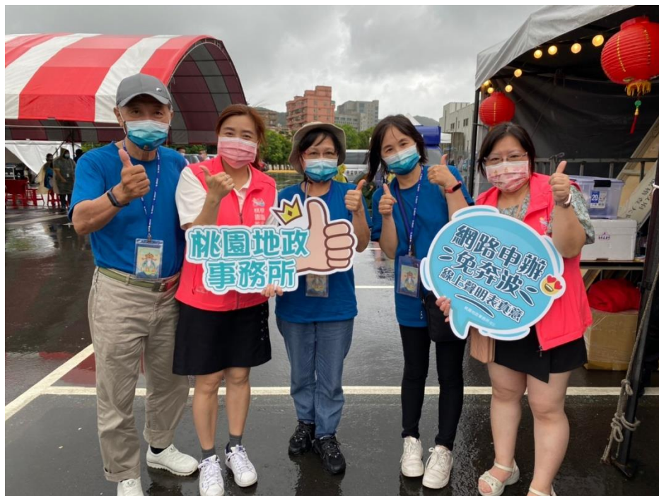
簡介：桃園地政事務所團隊及桃園區民眾合影