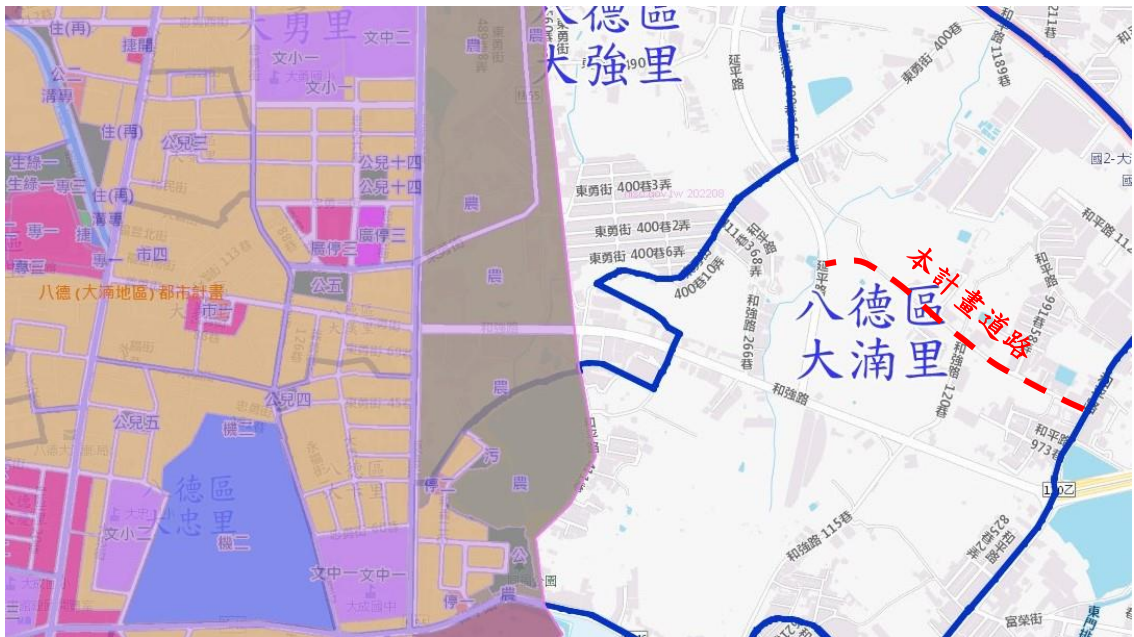
(圖 1)位於八德都市計畫東側