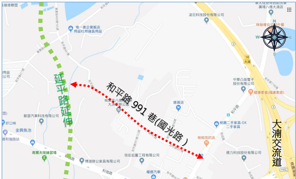
(圖 2)和平路 991 巷 (國光路) 拓寬計畫範圍圖