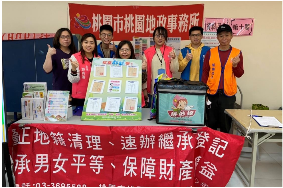
簡介：桃園地政事務所團隊及中正里里長合影