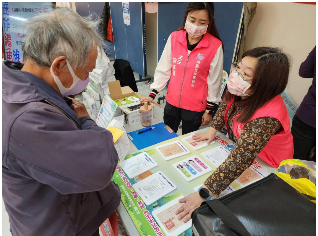
簡介：檔案應用翻翻樂