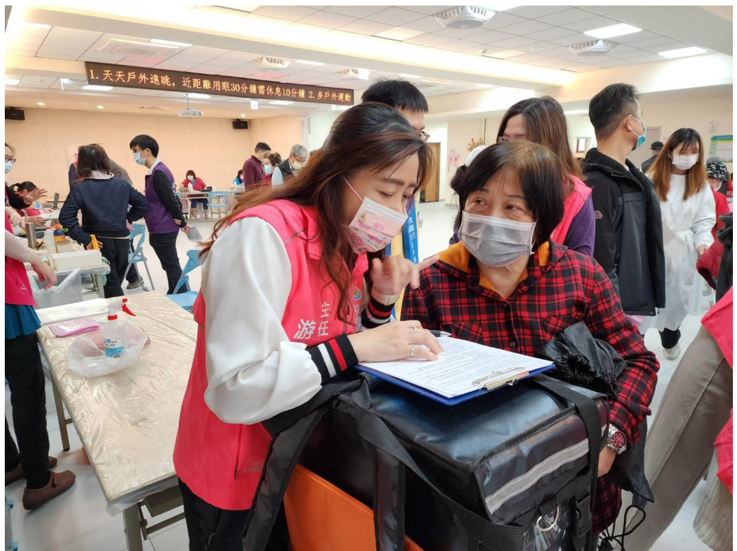
簡介：地政、檔案、性平有獎徵答