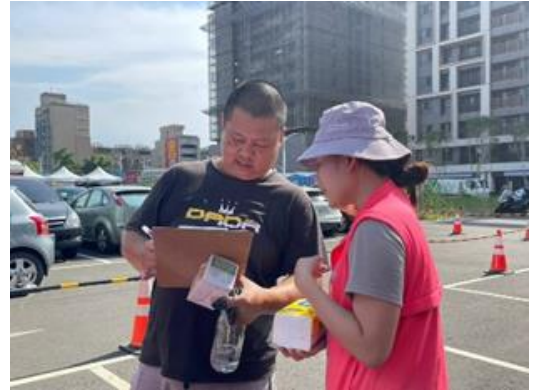
簡介：地政、檔案、性平有獎徵答