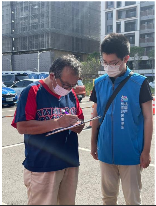
簡介：地政、檔案、性平有獎徵答