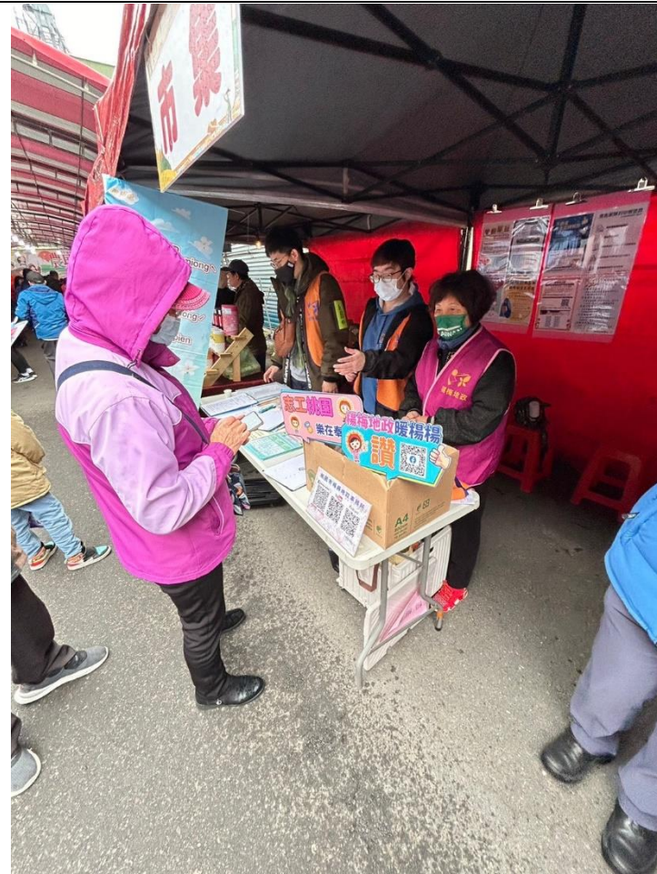
簡介：本所同仁設置攤位宣導地政、檔管及未辦繼承性別平等業務