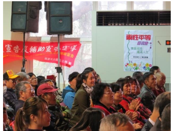
邀請農有及農村婦女參加