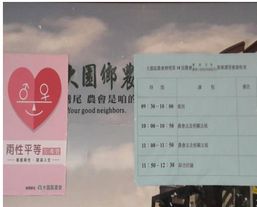
辦理兩性平等宣導會