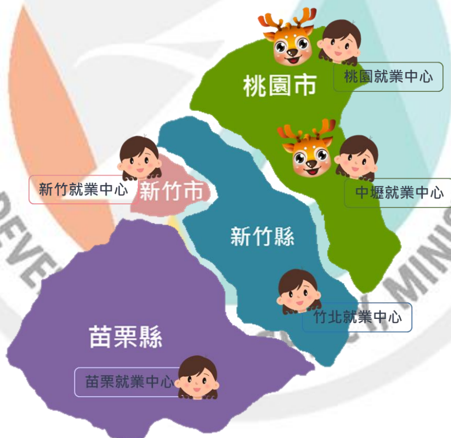
圖 1 桃竹苗轄區圖

本季報資料置於桃竹苗分署網站之「訊息中心-政府資訊公開-業務統計」網頁內，倘若不盡周全，敬請指教（ http://thmr.wda.gov.tw/ ）。