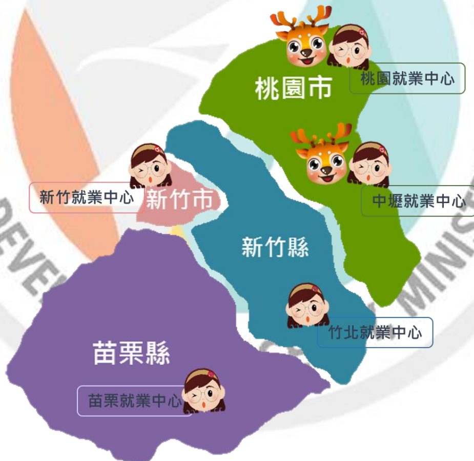
圖 1 桃竹苗轄區圖

本季報資料置於桃竹苗分署網站之「訊息中心-政府資訊公開-業務統計」網頁內，倘若不盡周全，敬請指教（ http://thmr.wda.gov.tw/ ）。