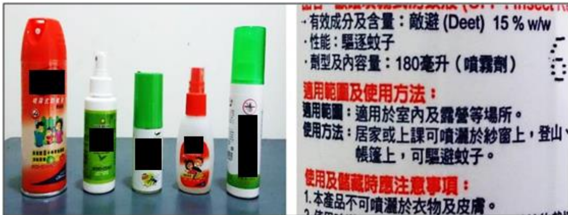
圖 17 左圖：市售防蚊液，成分為含有敵避 (DEET) 及不含兩類；