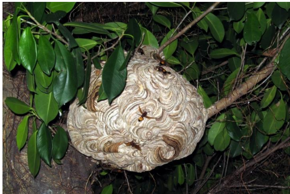
圖 8 黃腰虎頭蜂的蜂巢