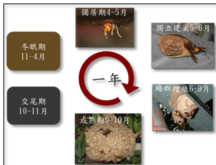
圖 16 虎頭蜂生命週期示意圖

俟近 11 月下旬，天氣逐漸轉冷，幼蟲減少，巢內的老工蜂壽命燃盡，此時如採摘到蜂巢，巢中可能只有少數成蜂