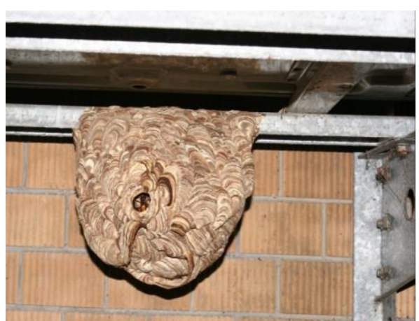
圖 15 虎頭蜂容易築巢之地點，左上：新店森林步道山壁上，左中：北市大安區公寓頂樓屋簷下，左下：北市中山區公寓四樓窗外，右上：台大校園儲水塔鋼架，右中：台大校園建築物窗型冷氣機旁，右下：台北市羅斯福路政府單位分離式冷氣室外機下。