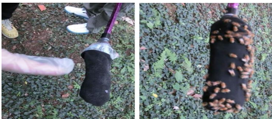
圖 18 左圖：噴灑含 DEET 成分的防蚊液的黑布，可防止蜜蜂靠近螫叮，