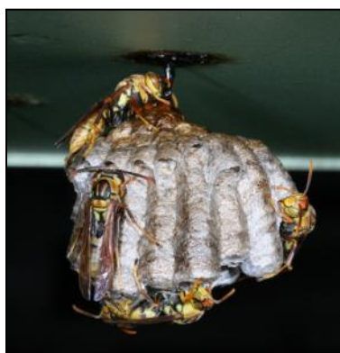
圖 2 位於屋簷下的長腳蜂

長腳蜂之成蜂飛行時，後腳垂下 ，黑黃相間且修長的雙腳十分明顯。屬原始社會性的胡蜂，蜂巢通常只有單個，形狀近似蓮蓬頭，外表無巢殼保護，蜂群個體通常少於 50 隻， 築巢地點大多在建築物上或矮灌木叢中 ，具攻擊性且與人類活動範圍幾乎重疊，不過，其傷害程度不若虎頭蜂猛烈。