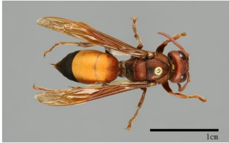
圖 7 黃腰虎頭蜂成蜂個體