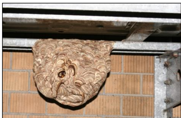
圖 3 分離式冷氣之室外機下的黃腰 虎頭蜂蜂巢