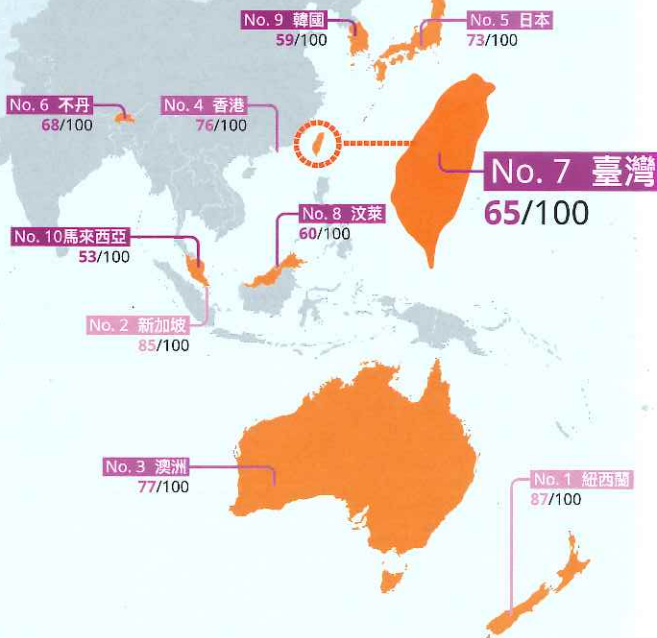
亞太區國家排名前十位置圖