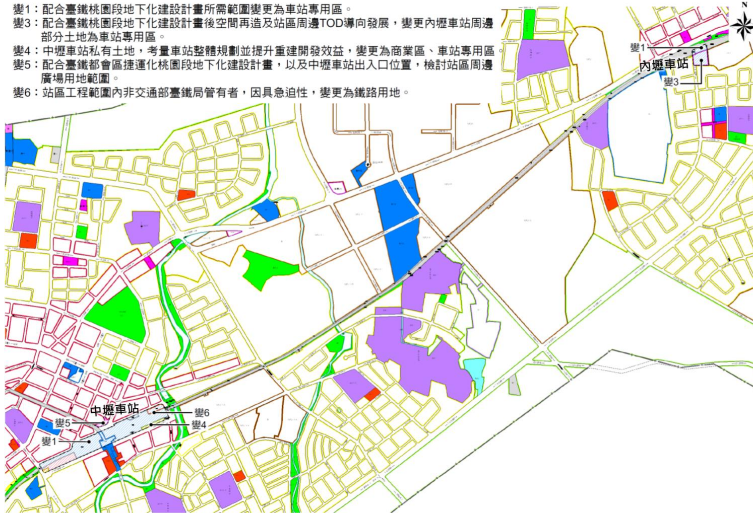
內壢站及中壢站變更位置及內容示意圖