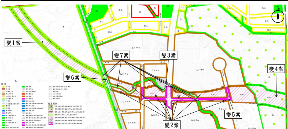
圖2 「變更南崁地區都市計畫(高速公路北側)細部計畫(配合國道1號甲線新建工程)案」 變更位置示意圖