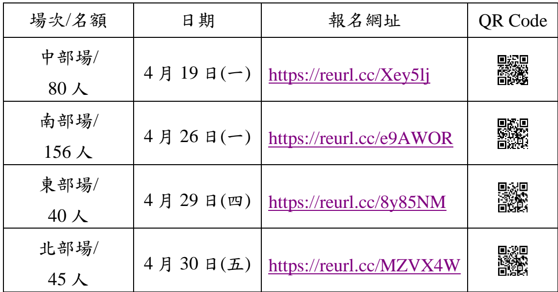
表二 各場次報名網址