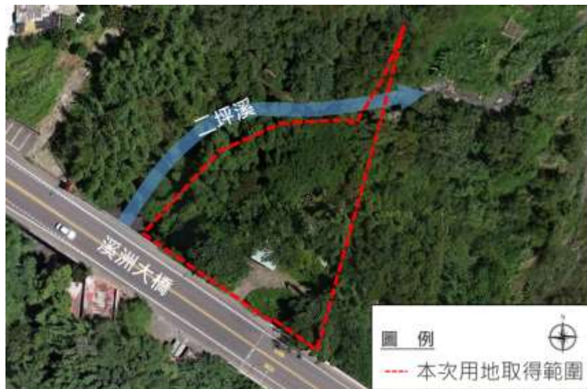
圖 3 土地使用現況示意圖

本案範圍內現況多為雜林木以及零星鐵皮建築物，並無任何農耕使用。土地使用現況如圖 3 所示。