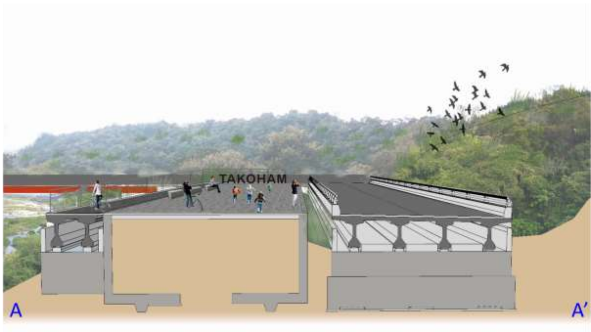
圖 2 工程項目及模擬示意圖