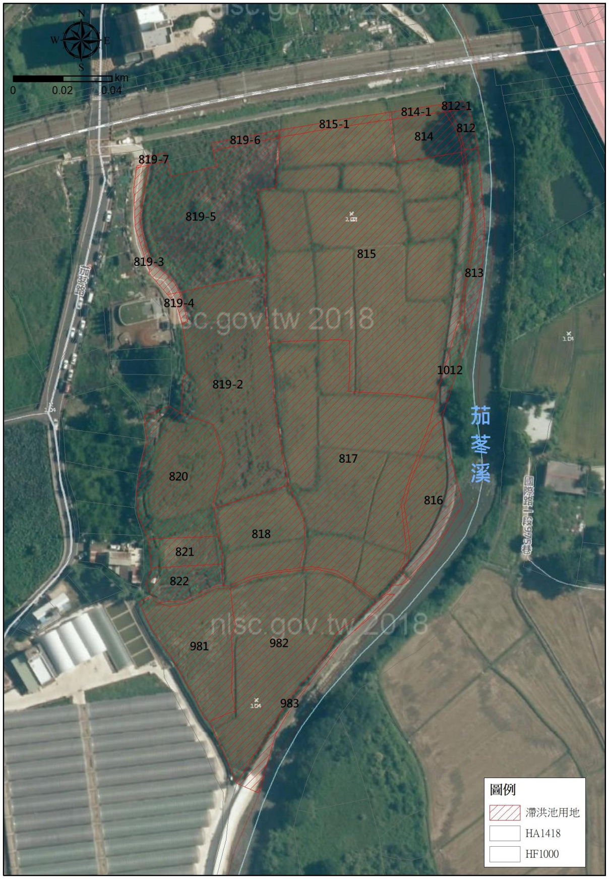
滯洪池用地範圍圖