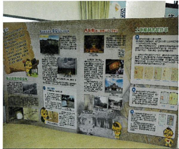
「情龜山坑 歡迎來入坑」五大坑百年檔案常設展。