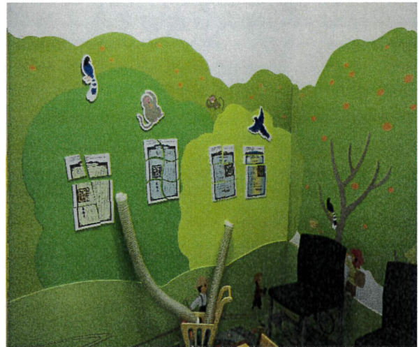
一樓兒童遊戲室提供權狀磁鐵拼圖，推廣地政檔案。