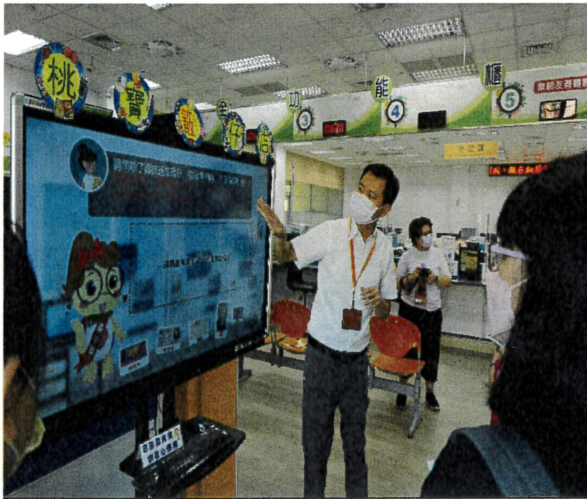
設置電子螢幕設置益智問答互動小遊戲。