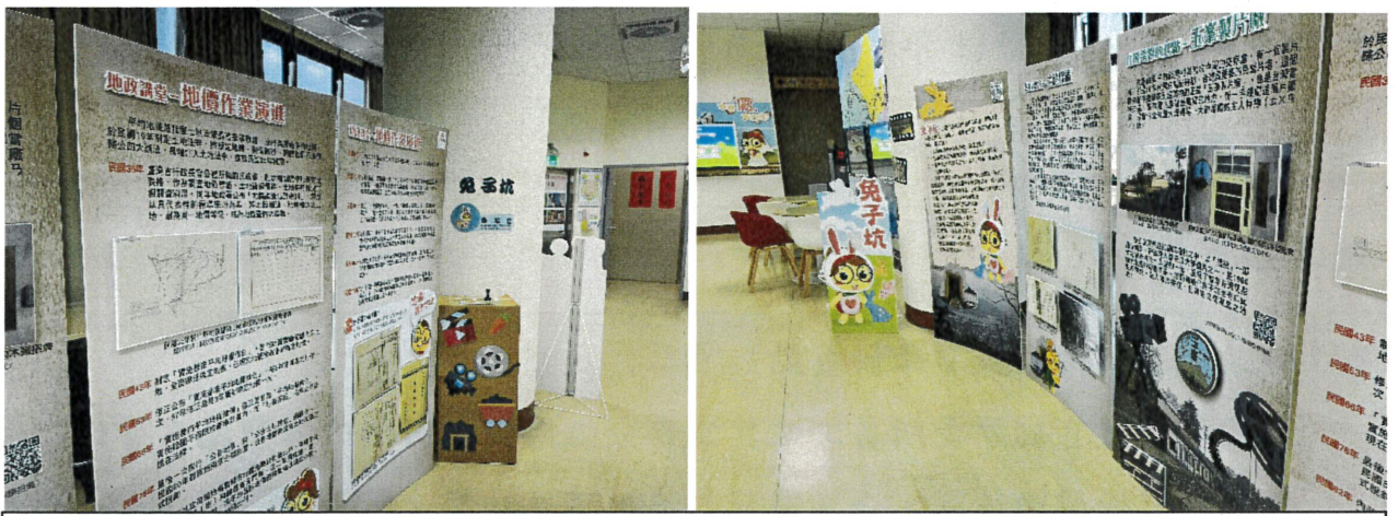
常設「情龜山坑 歡迎來入坑」五大坑百年檔案特展