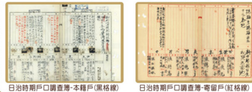
日治時期戶口調查簿-本籍戶(黑格線) 日治時期戶口調查簿-寄留戶(紅格線)