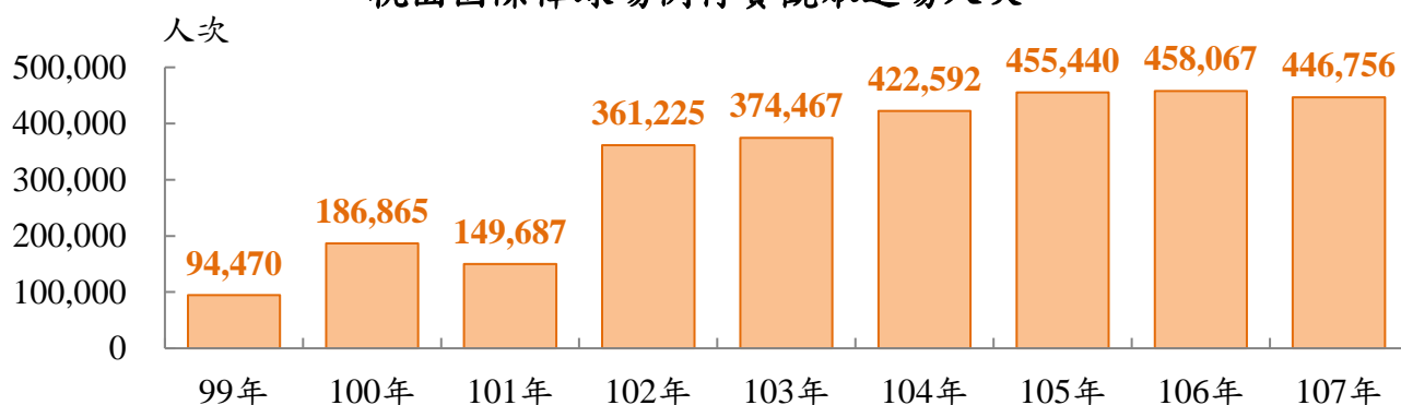
桃園國際棒球場例行賽觀眾進場人次

再由折算為平均每場例行賽觀眾進場人次觀之，99年桃園國際棒球場平均每場例行賽約有5,557人次，為職棒平均2,690人次之2.07倍；100至102年平均每場例行賽觀眾進場人次約與職棒平均相當，其中102年增至5,922人次，主因美國職棒大聯盟明星球員曼尼(Manny Ramirez)加盟職棒球隊，引起球迷關注所致；又Lamigo桃猿隊自103年起，落實單一主場制並革新加油應援方式，104年平均每場觀眾7,043人次，為球場啟用以來首度超越7千人次大關；107年平均每場觀眾7,446人次，僅較105年7,591人次之高峰，略減145人次，且與職棒平均5,458人次相較，每場觀眾約高出1,988人次。