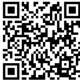
圖 1 i取號 Qrcode