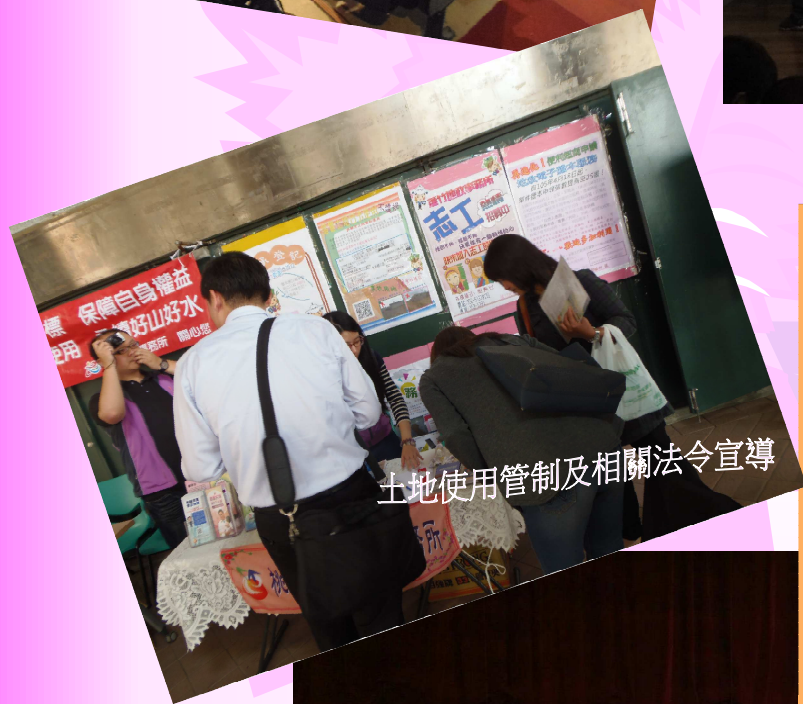
土地使用管制及相關法令宣導