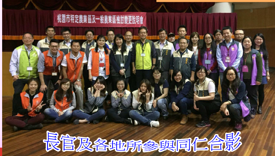
長官及各地所參與同仁合影