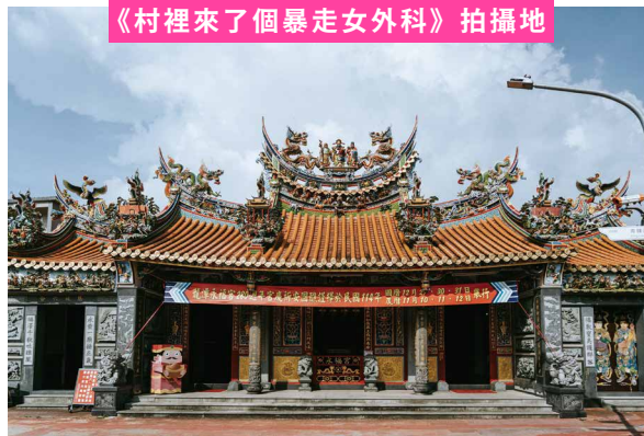
《村裡來了個暴走女外科》拍攝地