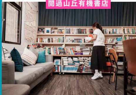
閱過山丘有機書店