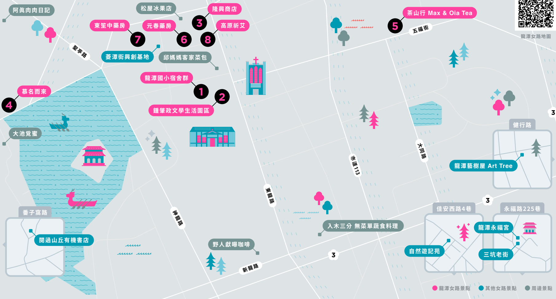
● 龍潭女路景點 ● 其他女路景點 ● 周邊景點

1 11:00 龍潭國小宿舍群 漫步菱潭街旁，感受教師們在日式宿舍群中奉獻教育的歲月印記。