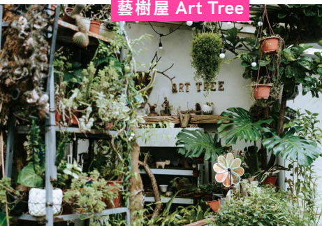
藝樹屋 Art Tree