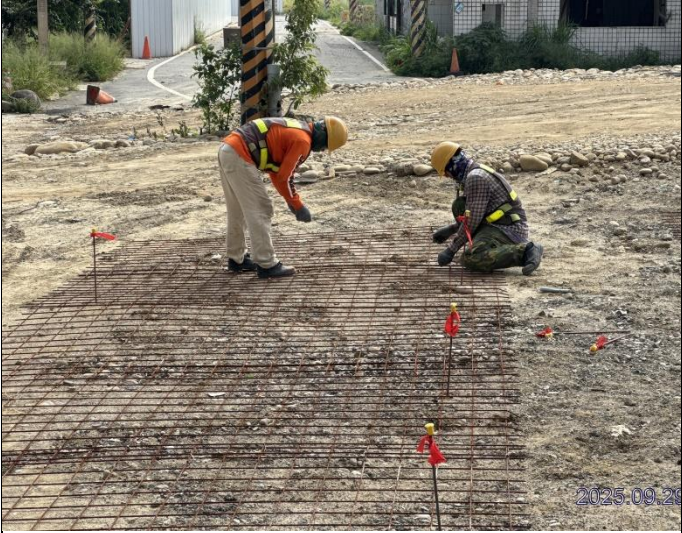
崁下橋施工便道施作