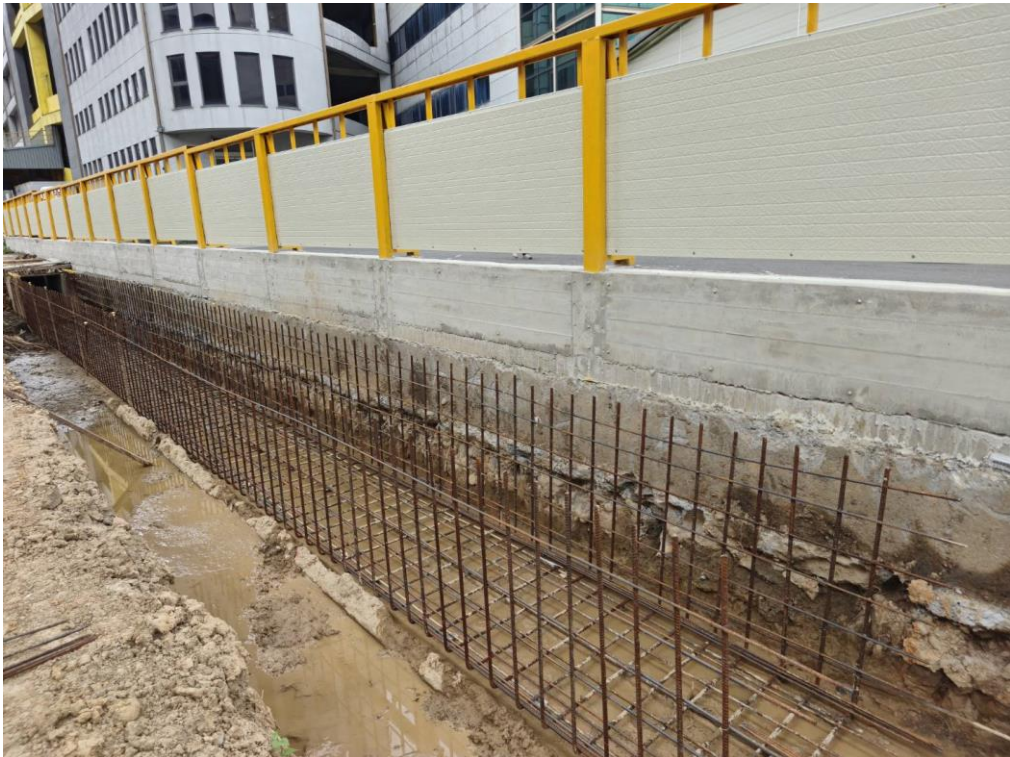
蘆興街排水箱涵底板鋼筋綁紮