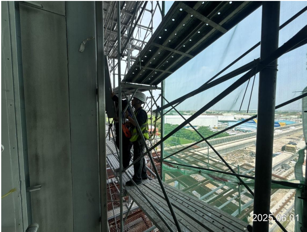
G15(原 G14)車站出入口三樓外牆鋁包板施作