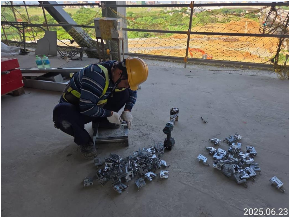
G15b(原 G32)車站 4F 電氣系統施作