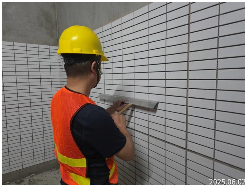
G14(原 G13a)車站出入口三樓內牆磁磚施作