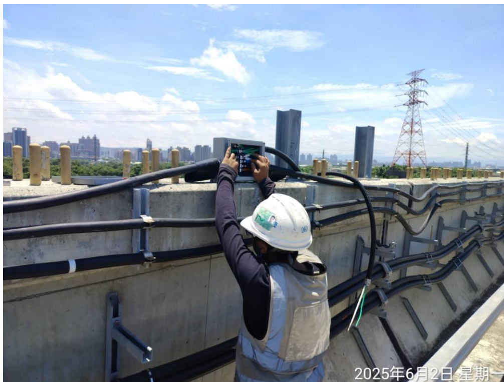
G13 車站高架電纜線施作