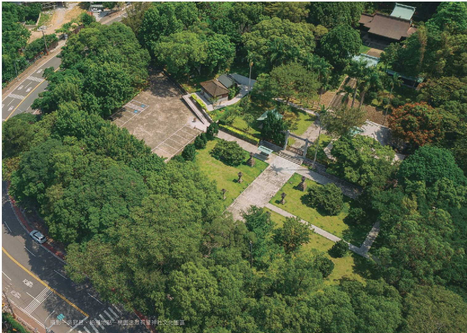
攝影／吳冠廷・拍攝地點／桃園忠烈祠暨神社文化園區