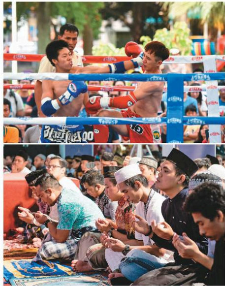
上圖——桃園國際泰拳大賽是移工以投票方式，選擇自己喜歡活動的第一名。下圖——桃園的穆斯林移工集結，以虔誠的心參與桃園開齋節活動。

外國籍婦幼諮詢服務中心提供諮詢與安置服務，像是從懷孕、生產到產假等相關法令諮詢，到辦理優生保健、孕期照護、育兒等事宜，能適時解決勞資