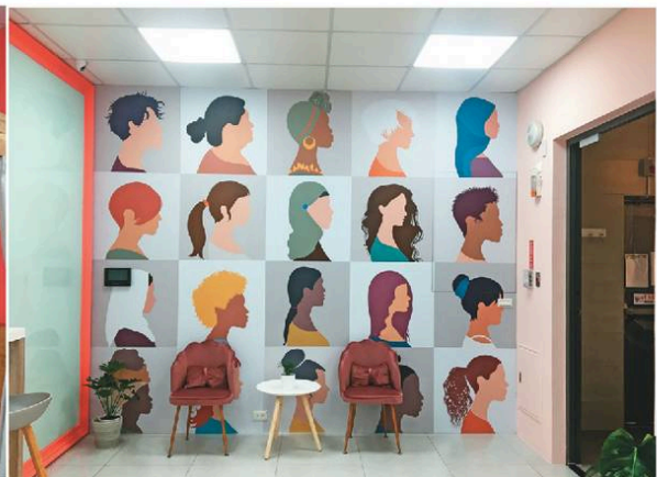
跨區域一站式服務的「外國籍婦幼諮詢服務中心」，提供服務專線供諮詢，也有讓人放鬆的友善溫馨環境。