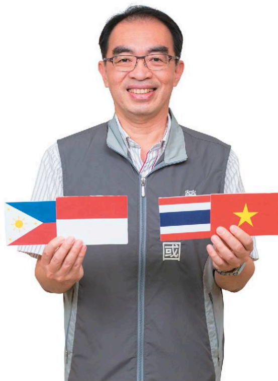
移工福祉在地落實 ——「給移工一個溫暖環境，讓他們在桃園安居樂業、融入在地，成為桃園多元族群的一部分。」—— 桃園市政府勞動局長·吳宏國