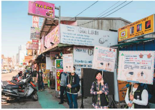
COVID-19疫情期間，為使移工能充分瞭解資訊，政府在移工聚集地點，以越南、菲律賓、印尼及泰國等多國語言加強防疫宣導。

桃園作為國際城市，也是工業科技大城，是許多製造業及物流業的基地，2022年5月底，桃園移工逾11萬人，移工人口數為台灣第一。桃園從移工訪視、諮詢服務等執行層面著手，成立「移工諮詢服務中心」，聘請多國籍、熟悉母語的工作人員，協助移工處理勞資爭議，必要時能提供安置保護、協助轉換雇主或依法裁罰；另外，也配置了44位移工生活訪查員，實地訪視移工的勞動條件及居住環境，針對薪資發放、生活照顧項目進行檢查，