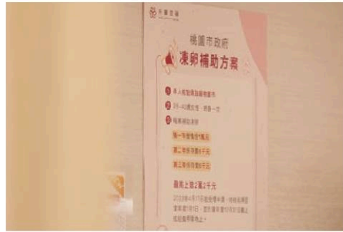
桃園凍卵營養補助金，25至40歲皆可申請，補助最高上限2萬2千元。