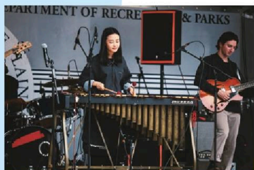
上：魯千千，桃園人，旅美爵士音樂家，亦為53屆金曲獎演奏類專輯獎得主。