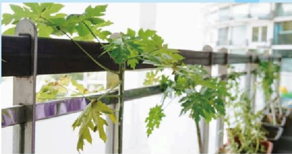
老師帶著孩子們種植蔬果，透過實際操作瞭解植物生長、結果的過程。

兒多年，較清楚孩子的發展曲線。通常語言能力發展比其他小朋友慢是較明顯的病徵，我們也會觀察肢體協調程度，甚至是眼神飄移等情況。」仰賴長年經驗累積與細膩的觀察，中心只要一發現嬰幼兒疑似有發展遲緩，便會先知會家長，並視實際情形即時通報相關單位及早提供後續協助，透過早期診斷和早期療育的適當介入，把握兒童發展黃金時期，幫助孩子銜接發展以融入團體生活。