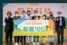
2021 首獎 跨時空災害防衛隊 ▽ 新北市烏來區

由一群不同領域與背景的專業工程人員與創客，為避免家園受到山坡地的災害，與鄉公所合作，開發即時通報警示，並結合在地原民部落的傳統災害經驗知識與協力，達到預防性避災的目標。