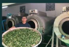
2021 優等獎 峽茗遠播行動派 ▽ 新北市三峽區

由一群不同領域與背景的專業工程人員與創客，為避免家園受到山坡地的災害，與鄉公所合作，開發即時通報警示，並結合在地原民部落的傳統災害經驗知識與協力，達到預防性避災的目標。