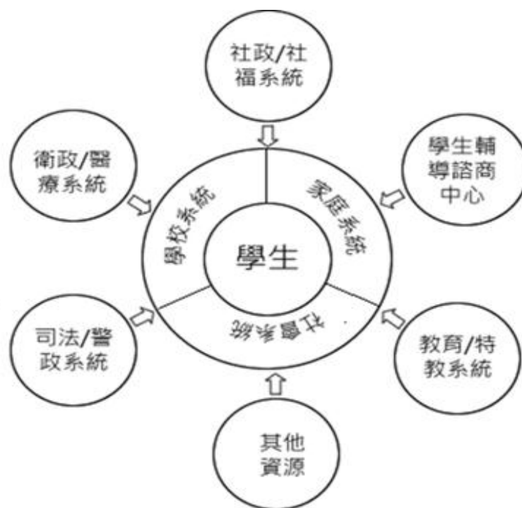
圖 3-2：學生為中心的輔導合作團隊運作模式

並連結外部資源系統，如精神/醫療院所、社福警政機構、社會福利機構、中途學校等外部資源。此模式是以學生為中心，期能有效協助開發轉介學生之潛能、促進適性發展與學校適應。